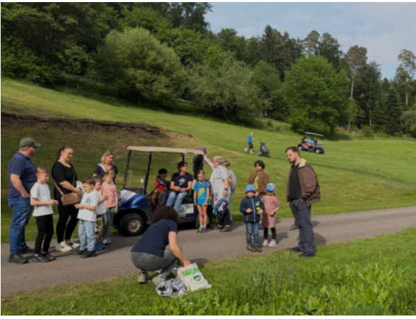
Mit Fors- chun- gsbö- gen auf Safar